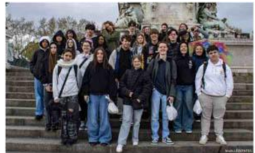
Les élèves de première ont pu voir plusieurs expositions et expérimenter des prises de vues.

La classe s'est ensuite rendue à la MECA, lieu de création contemporaine, pour visiter l'exposition « PrimaveraPrimavera » du Frac Nouvelle-Aquitaine (fonds régional d'art contemporain), qui mêle installations, photos, vidéos et pein-