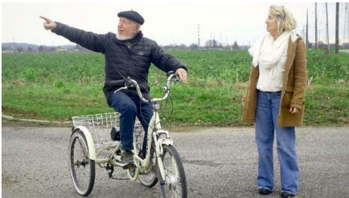
Recueil de témoignages des aînés du village