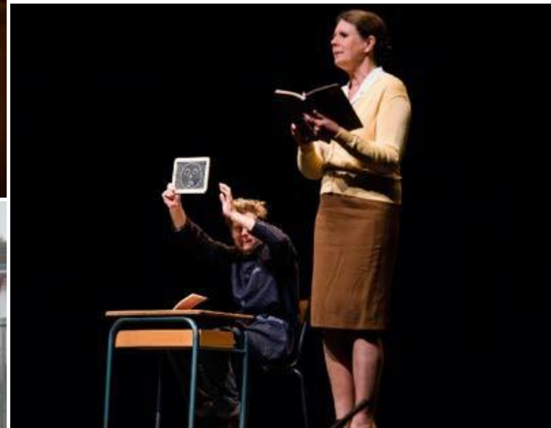
Les aînés apprennent les jeux de récréa=on aux enfants