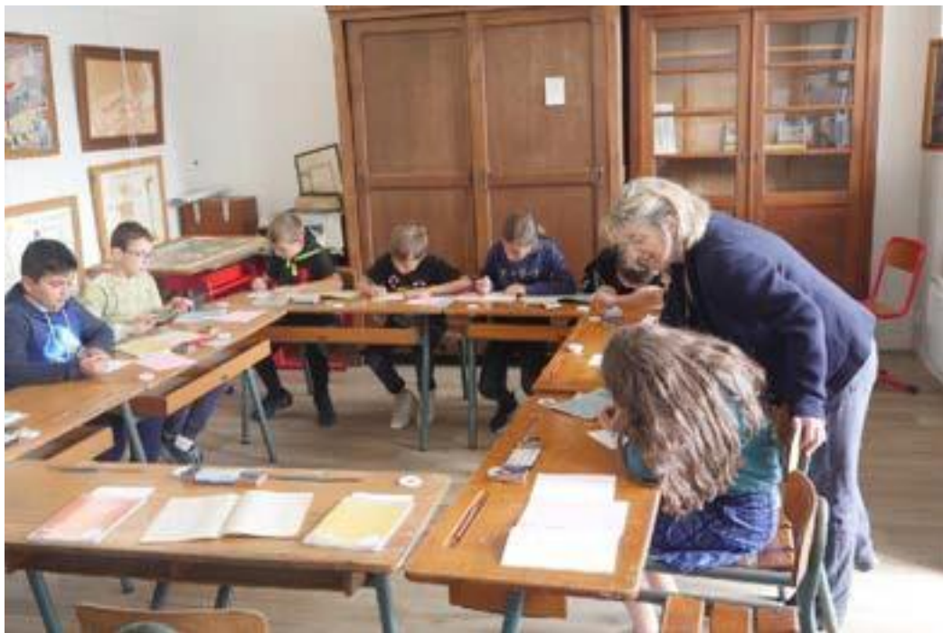
L'école d'autrefois animée par les séniors