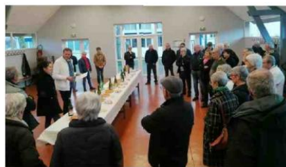
La présentation des vœux et la dégustation de la galette ont été l'occasion de présenter les animations de 2025.

ments joyeux qui font tant de bien et qui permettent de maintenir ou tisser des liens sociaux », assure-t-il, rappelant les nombreuses activités sportives ou festives de l'association. Ainsi, le traditionnel repas béarnais est organisé le samedi 8 février à 19h30 à la salle Piquemal (tarif 16 euros, inscriptions obli-