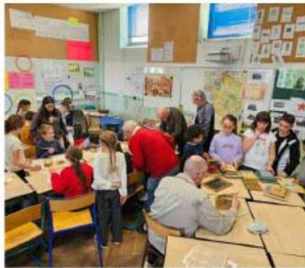
Livres et cahiers d'école, écriture à la plume, cartes et photos... Les jeunes ont pu découvrir le matériel utilisé par leurs prédécesseurs. R. D.

Quelques anciens du Foyer Rural sont venus pour raviver des souvenirs d'enfance mais aussi échanger avec les jeunes. Ils se sont d'abord prêtés au jeu de l'écriture : pas évident quand on n'a pas touché une plume depuis plus de