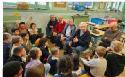
La rencontre s'est terminée par un temps d'échange sur les différences entre l'école d'hier et celle d'aujourd'hui. R. D.