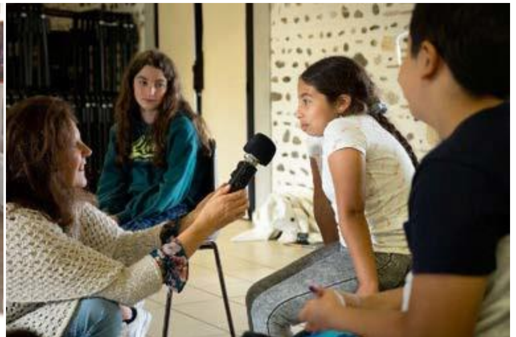
Enregistrements des enfants