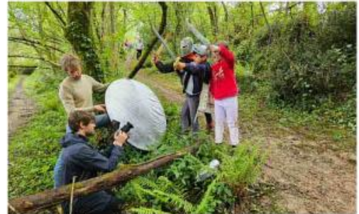
Une première expérience du cinéma pour les élèves. N. D.

nique du montage. Ils ont également fait appel à Lucien Molina pour assurer les prises de son. Les enfants ont ainsi pu partici-