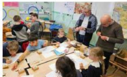
Différents ateliers ont été proposés comme la découverte de l'écriture à la plume. Un exercice pas évident pour les élèves d'aujourd'hui. R. D.

Les élèves avaient peu de sorties, « à part dans le quartier, on se promenait notamment dans les bois. Et on faisait beaucoup de sport ! On avait des courses en relais et l'instituteur suivait à vélo ». Pas de déplacement à la piscine, « on n'a jamais appris à nager », mais tous les ans les écoles d'Orthez participaient aux « lendits » : « C'étaient des rencontres sportives qui se déroulaient au stade Cazeneuve. Toutes les écoles d'Orthez et des environs s'y retrouvaient. On faisait de la gym, des sauts, des courses, des figures... et il y avait un classement à la fin », expliquent les anciens. « Castétarbe arrivait souvent en première position », ajoute fièrement l'un avant qu'un autre ne rétorque : « Saint-Gérons n'était pas mal non plus ! » A chacun sa fierté et à chacun ses souvenirs. N. D.