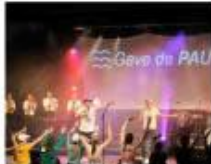
Chaque année, le théâtre Planét est prêt à craquer.